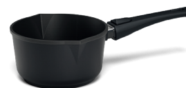
STONIQ-Stieltopf Ø 18 cm