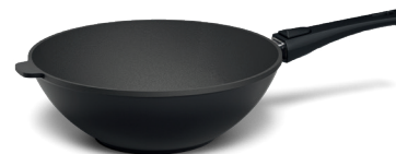
STONIQ-Wokpfanne Ø 30 cm