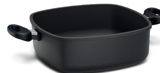
STONIQ-Bräter eckig 28x28 cm