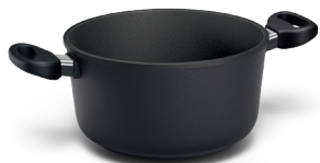
STONIQ-Kochtopf Ø 20, 24 und 28 cm