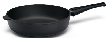
STONIQ-Hochrandpfanne Ø 24 und 28 cm